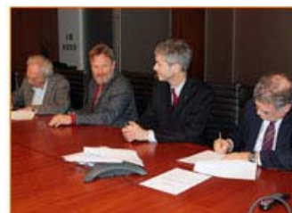
Signature de la convention