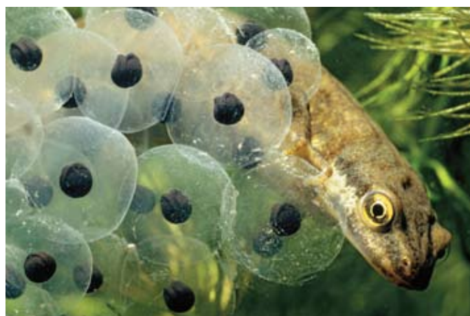
Stéphane Vitzthum - Triton pontué