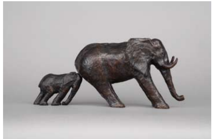
Sophie Verger - Opposition