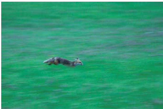
Fabrice Cahez - Renard roux