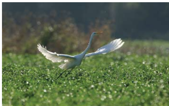
Fabrice Cahez - Grande aigrette