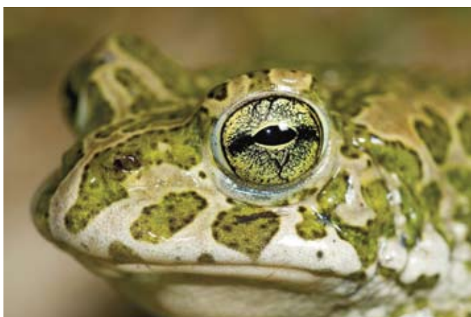
Stéphane Vitzthum - Crapaud vert